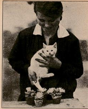
Abb. 4. Hat man keinen Marderhaarpinsel, hilft man sich, wie diese freundliche Gärtnerin hier zeigt! Mesembrianthemum coronatum Hor, bester Blüher, bis 7,5 cm Durchmesser