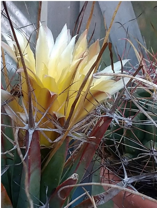
Leugenbergia principes, Veroniek Bicknese