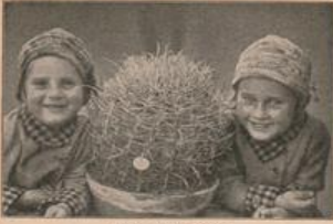
Abb. 2. Ets. cytharocera